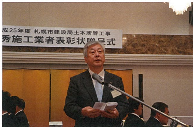
●受賞者代表謝辞（阿部社長）