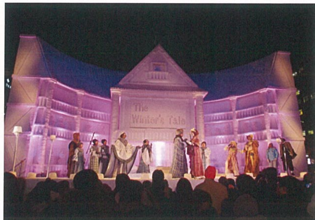
●演劇上演中