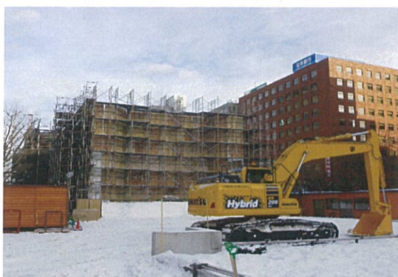
●大雪像制作状況 初期