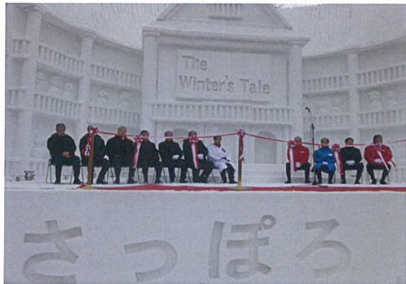
●オープニングセレモニー①