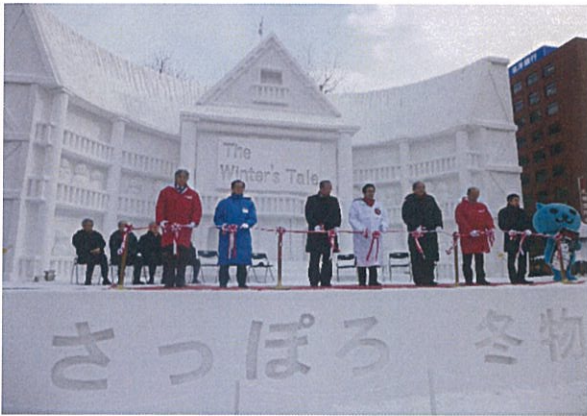
●オープニングセレモニー②