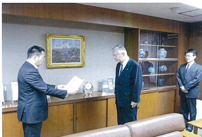
阿部所長からの感謝状贈呈