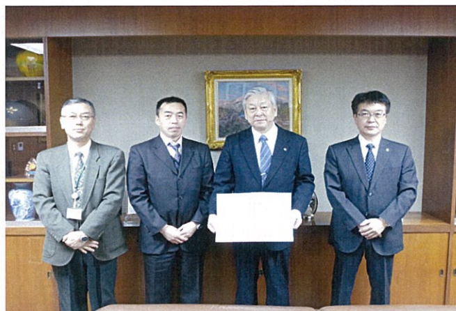
黒田副所長、阿部所長、社長、川島部長